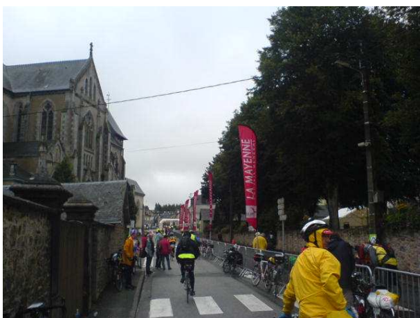
Villaines mod aften ...

I Villaines var vejret atter gråt i gråt. Efter stempel og mad kørte jeg ud i regnen klokken 20:00; lyset skulle tændes allerede da. Jeg havde ikke kørt mange hundrede meter, før tidligere forvarslere om problemer med ryg og nakke blev