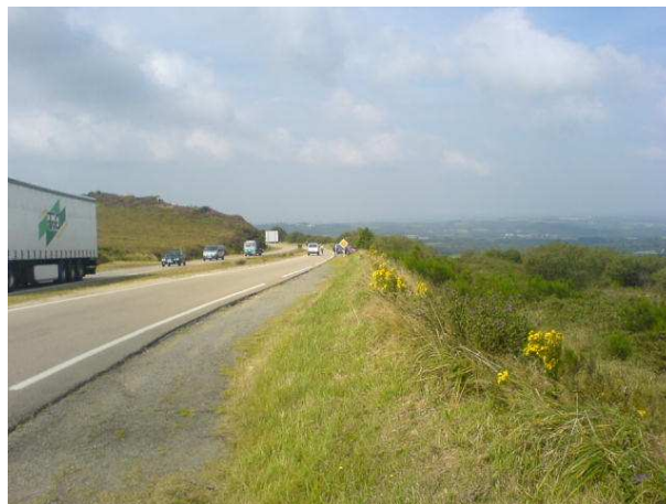
Mellem Carhaix og Brest – her rutens højeste punkt

inden løbet. I Brest og halvvejs klokken 14:03 om onsdagen var vejret stadig godt, nu med solskin og varme. Det virkede ganske fornuftigt, for der var jo stadig mere end to døgn til de sidste 613 kilometer.