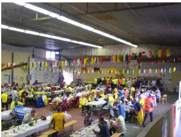
Fra et af kontrolstederne, dog ikke Loudeac ...

Randonneurerne snakker meget om Loudeac, når talen er om P-B-P. Det ligger en god tredjedel ude af ruten, altså 450 kilometer, så her er det oplagt at holde første lange hvil på vejen ud og den anden på vejen hjem. Men da alle synes at tænke sådan, er det klogt at overveje mulige alternativer, hvis man ønsker en egentlig soveplads. Da jeg satte cyklen fra mig i regnen, opgav jeg i hvert fald tanken ved synet af den lange kø ved hallen, hvor man sover. Men skulle jeg have gavn af den tørre trøje og bukserne i tasken, skulle jeg skifte nu.