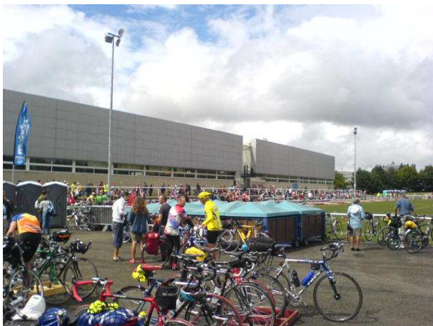
Gymnase des Droits de l'Homme – sted for cykeltjek, start og mål

Efter en god nats søvn var det tid til en sidste overvejelse over cyklen og gennemgang af alle detaljer. Virkede lyset nu også ved kontrollen, og skulle bremserne ikke justeres lidt? - alle de sunde og beroligende overvejelser, et nervøst gemyt kan gøre sig, blev gjort igen og igen. Men så var klokken pludselig et, og det var af sted til indskrivningen og cykeltjek. Det sidste viste sig aflyst på grund af vejret, det ville i stedet ske dagen efter ved starten.