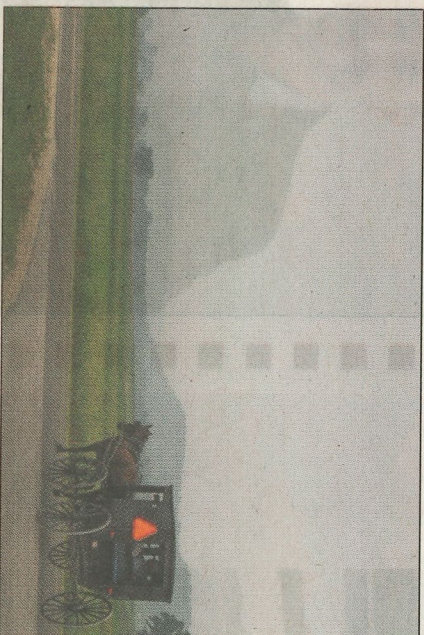
Amish-samfund langs ruten.

Jeg havde planlagt at starte ud hver morgen omkring kl. 04.00, for at udnytte de lyse timer mest muligt. Det lykkedes stort set. Jeg oplevede derfor 4 farvestrålende solopgange og to ligeså smukke solnedgange.