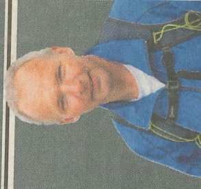
Af SØREN RØNN HANSEN MOTIONSSKRIBENT, GRENAA