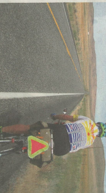
Vejen ligger åben til en cykeltur på 1.289 km.

400 km tilbage indså jeg, at jeg måtte ændre taktik, tage turen i mit helt eget tempo og fortsat såkaldt knæet mest muligt, hvis jeg skulle gennemføre løbet.