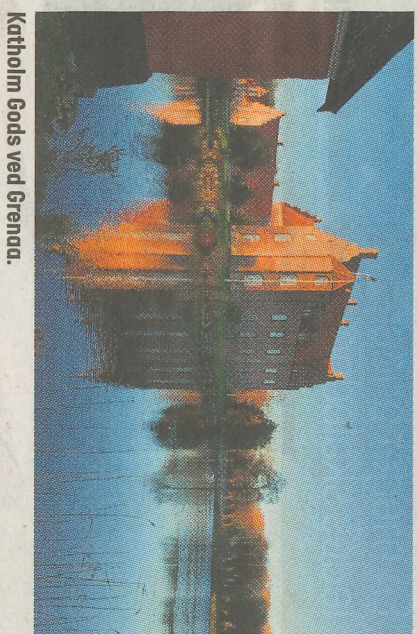
Katholm Gods ved Grenaa.

KLUMME: For de fleste motionscyklister er vinteren en stille tid. Mørke, vejrig og føre lægger en demper på udfoldelsen. Mange skifter derfor racercyklen og landevejen ud med en mountain bike og eventuelt nogle skovstier.