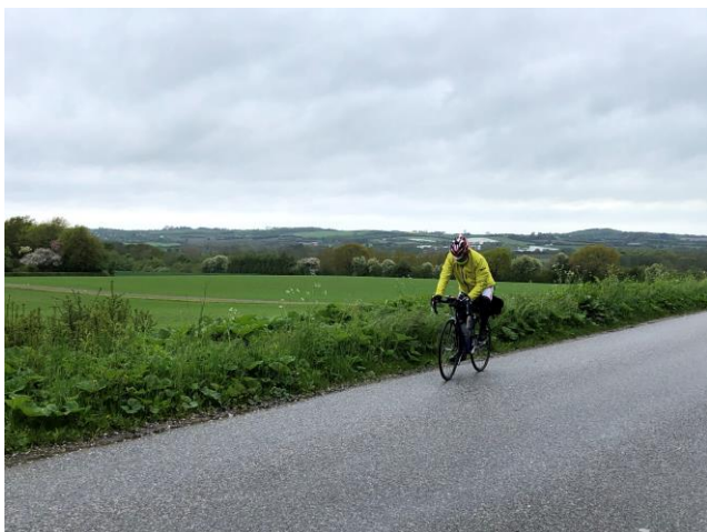
Udsigterne er gode i de fynske Alper

En kort pause med lidt forplejning ved Vesterport bageri i Fåborg og videre langs kysten til Svendborg. Undervejs med en kontrol ved Rantzausminde efter 114 km. Vinden er efterhånden tiltaget og kommer direkte fra syd. Vi ser derfor frem mod en lidt hård tur i direkte modvind uden ret meget læ over 3 broer og et par øer til Langeland og Bagenkop. Enkelte relativt lette regnbyger undervejs bliver afløst af et regulært og ret kraftigt regnvejr 10 km fra Bagenkop, hvor vi håber på et varmt måltid mad indendørs i tørvejr. Alt er imidlertid optaget på restaurant Havblik og vi må søge til den nærliggende take-away grillbar. Det lykkes os ovenikøbet at finde et sted med ly og læ på havnen. Første klasses udsigt, men temperaturen på 8 gr. i byen er ikke overvældende, ja nærmest direkte koldt. Selvom man knuger fingrene om den lune burger er det ikke nok til at holde dem varme.