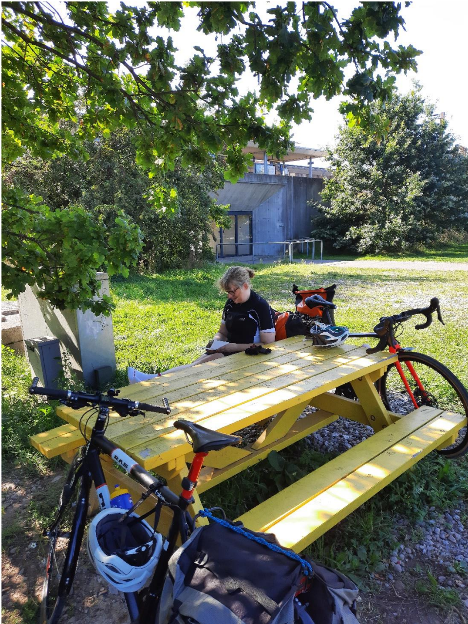
Venterum ved Nyborg Station

I Langeskov blev der tid til et stop på en tankstation. Ved ankomsten til Nyborg Station var der ventetid på at komme over broen med cykler. Vi kom med kl. 15.40. Glemte at sætte garminuret på pause. Det viste 170 km i timen.