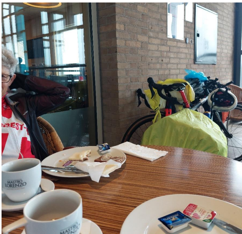
Høje Tåstrup station er nået.

Overnatninger blev booket 7 uger før afrejse. Det var lige ved at være for sent.