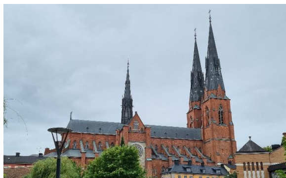
Domkirken i Uppsala

være holdbart i længden. Da jeg noget rutineret tabte en drikkedunk efter ca. 40km kom det nu helt naturligt med farten, da jeg nu var alene. Om end farten var faldende så kom jeg stadig til Gysinge og første kontrol med over 30 i snit. Det er et meget lille sted med en ubemandet landhandel som ikke var meget bevendt. Der gik dog en mand rundt som kunne skrive i vores kontrolkort. Han var meget forvirret og virkede omtåget som var han påvirket. Det var ikke muligt få fyldt flasker eller andet. Der havde heller ikke været andre muligheder hidtil. Regnen havde haft en indvirkning til at jeg drak mindre end ellers. Men nu