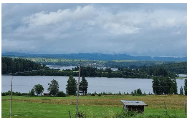
Nedbørstruende skyer nær Leksand