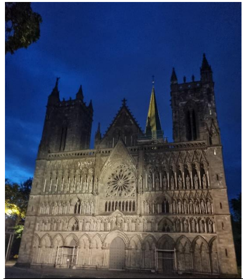
Domkirken i Trondheim

af kløften med elven brusende nedenfor os. Således nåede vi Støren i rekordfart kl. 21.46. Det synes måske ikke særlig hurtigt, men siden vi tjekkede ud i Røros efter lidt for meget sniksnak og en masse kludren rundt inden alle var klar, var der kun gået 3 timer til 105km inkl. pausen hvor vi tog mere tøj på. Her fik vi atter hældt en masse kalorier indenbords så vi kunne køre de sidste 69km. De var desværre ikke ned ad bakke men mere på flad vej langs hovedvejen. Dog stoppede regnen igen sammen med dagslyset der forsvandt. Netop som vi regnede med at det skulle være sådan hele turen, ledte ruten os væk fra Hovedvejen og ind på nogle mindre veje. Det var ikke til min fordel da jeg var ved at løbe tør kræfter denne dag. Derfor sneglede jeg mig også langsomt op ad de bakker der følger med de mindre veje. Det betød også at vi entrerede Trondheim ad mindre oplagte veje. Ikke mindst i mørket hvor man visse steder skulle være vågen for ikke at køre i en bom eller lignende. Men vi kom ind i byen og kom forbi Domkirken her som fuldender yderpunktet som kan udgøre pilgrimsturen. Herfra var det en passage gennem en sovende by til kontrolstedet. Et kontrolsted jeg havde bildt mig ind, havde en bruser. Men den måtte vi slukøret se langt efter. Et måltid mad og en madras var der dog. Så nu gjaldt det bare om at få mest muligt tid på øjet.