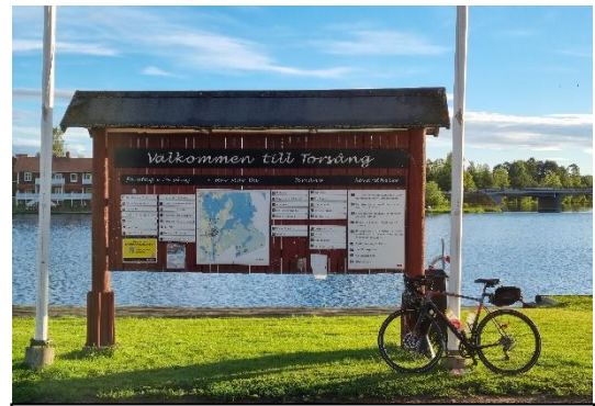
Morgenstund med guld i mund i Torsäng

Efterspillet blev lidt mudret da jeg sidst på aftenen kørte ud efter mine dropbags. Selvom de skulle være bragt tilbage sidst på eftermiddagen, så var de ikke ankommet og de vidste ikke hvornår de ville komme, men det ville senest ske en time efter jeg senest skulle køre for at nå min færgeafgang i Halmstad. Det var en kæmpe stressfaktor, men heldigvis så var de kommet en lille time før jeg kørte derud igen næste formiddag. De var dog villige til at sende dem til mig, såfremt de ikke nåede retur, men det ville bare være rigtig træls at have dem til hænge i systemet på den måde. 6,5 timers bilkørsel bagefter giver tid til at reflektere lidt over turen. Jeg synes den sådan helt generelt får bekræftet mig i, hvorfor jeg gør det her at køre mange hundrede kilometer i træk. Det er faktisk noget, jeg synes er sjovt, udfordrende og inspirerende. Det er giver nogle særprægede naturoplevelser, hvad enten det er fra toppen af et fjeld eller bunden af en