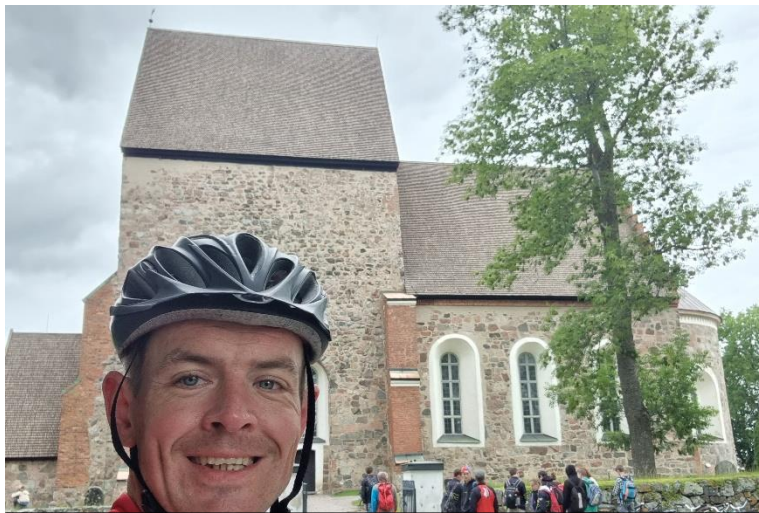
Selfie foran den gamle kirke i Gamla Uppsala

dal. Det er råvildt i alle afskygninger og brusende elve lige på den anden side af autoværnet både i solskin og regnvejr. At gennemgå alle de scenarier i landskabet samtidig med at man måske kæmper med træthed og krop og hoved, for så en halv time senere at have kæmpe optur og føle sig uovervindelig fordi man lige har fået en cola eller hvad der nu virker for det enkelte individ. Så er det ikke bare en fiks ide. Så er det en passion. Og det er lang tid siden jeg har fået min hobby bekræftet på den måde.