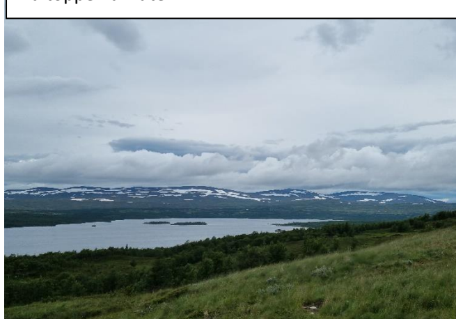
På toppen af ruten

stadig så da vi passerede et lille supermarked ca. halvvejs stoppede vi igen. Det var dog et beskedent udvalg i "to go" varer. Men lidt sodavand og snacks kan brandslukke en del. Nu kom nogle længere stigninger og vi nåede turens højeste punkt i 900meters højde. Med trægrænsen noget lavere fik vi en fantastisk udsigt. Uanset hvor mange billeder man tager, giver det desværre ikke den samme oplevelse som at være der. Jeg forsøger ellers ihærdigt hver gang, men det forbliver desværre kun en påmindelse til et minde. Tilbage til virkeligheden så skal alt der kommer op også ned igen. Så efter en nedtur af den gode slags kom sidste bakke