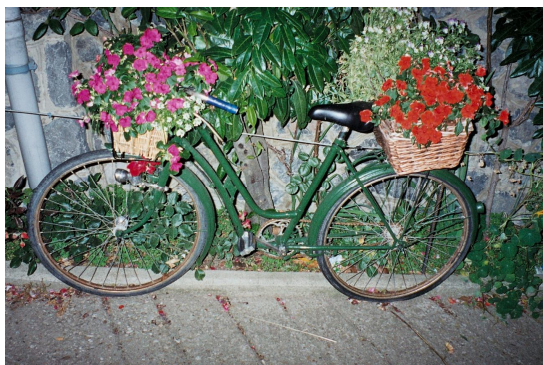
Udsmykning foran hotellet i Riano