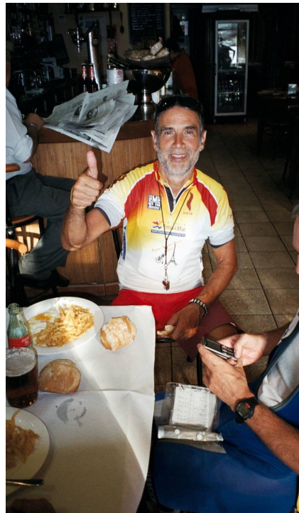
Radio Madrid – oplagt som altid

Vi nåede Gijon ved Atlanterhavet kl. ca. 14.00 og sammen med Radio Madrid, påbegyndte vi, efter et lille måltid i byen, hjemvejen mod Madrid ( Algete ). Der var nogle kraftige bakker som skulle forceres og vi havde ligeledes en større opkørsel efter Cangas, som skulle forceres i mørke, inden vi ville komme