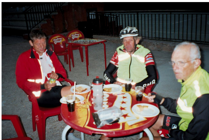
Morgenmad på 2. depot

foran i gruppen og havde ikke bemærket at vi havde fået defekt, så han sad og ventede på os på næste depot, og troede at han blot havde kørt rigtig stærkt.