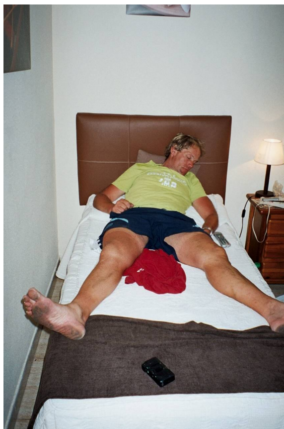
Et træt lokomotiv fra Salling napper en velfortjent lur

Behøver jeg at fortælle, at da bussen stoppede i en stor underjordisk rutebilstation i en forstad til Madrid, mødte jeg en spanioler, som tilfældigvis havde arbejdet et år i Thisted for 2 år siden. Han hjalp mig, som det mest naturlige, gennem metroen og videre til busstationen i det centrale Madrid. Jeg kom med den lokale bus til Algete, hvor jeg straks mødte mine glade holdkammerater, der i mellemtiden var kommet i mål. Sådan endte historien lykkeligt for os alle.