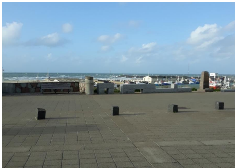
Udsigt fra Lilleheden i Hirtshals

Eftermiddagskaffen fik vi på Lilleheden (ikke savværket, men restauranten) i Hirtshals kl. 17.00. Herefter var det ud i det åbne land med nogle kraftige vindstød. Fra Tornby kom vi i læ i klitplantagerne.