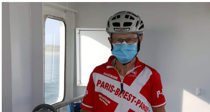
Maskeforbuddet er ikke ophævet