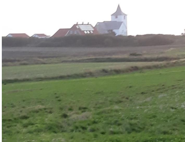
Udsigten fra vores værelse.