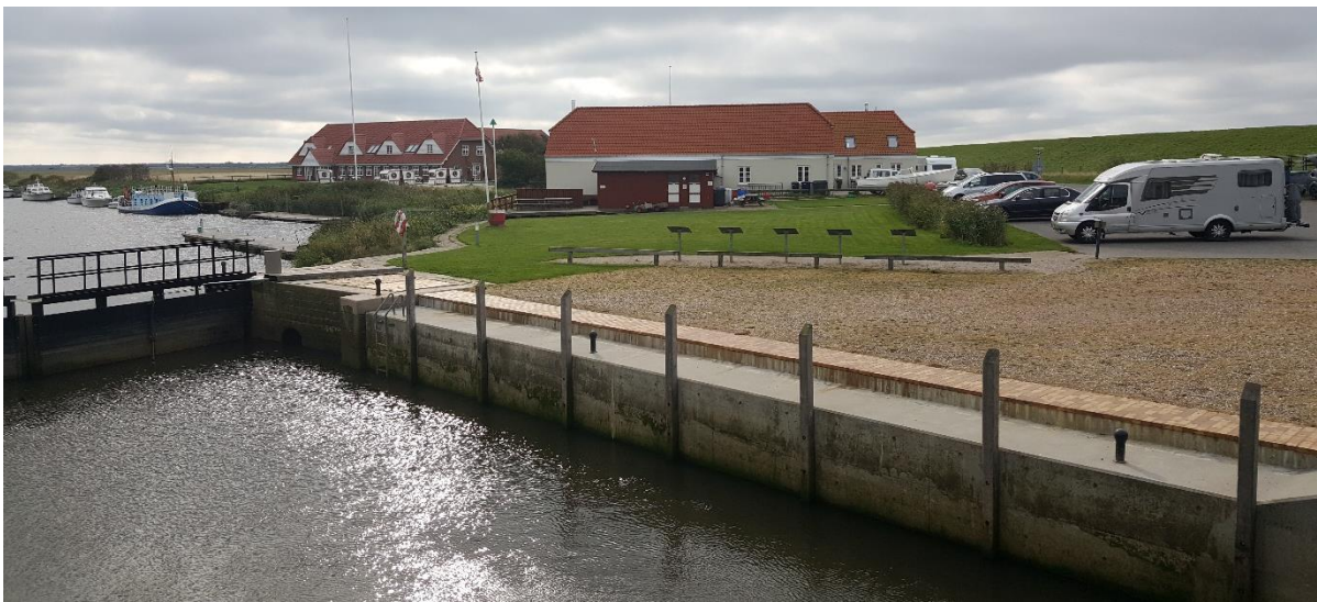
Restauranten ved kammerslusen