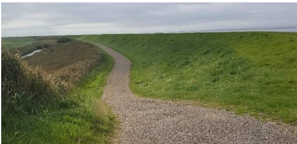
Fra en dæmning

Vi holdt et lille stop i Højer ved Højer Pølser, og kiggede forgæves efter en butik med kaffe og kage.