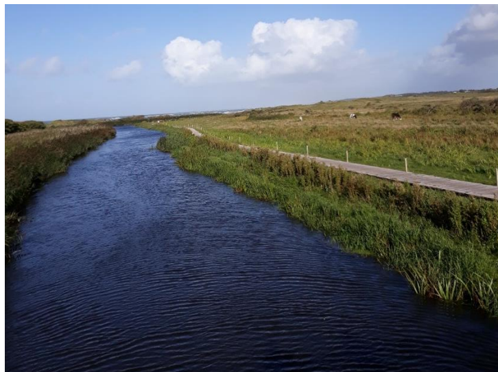
Fra broen over Uggerby å mod Vesterhavet

Vi skulle følge skiltene på rute 1. Nogle steder manglede der skilte. I Uggerby gik det galt. Her kom vi op på den store vej. Efter lidt kortkiggeri kom vi tilbage til ruten, hvor vi skulle over Uggerby Å. Der er lavet en imponerende bro. Det var et meget flot terræn i plantagerne tæt ved vandet.