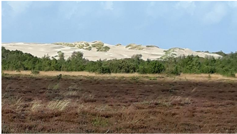
Vandreklitten Råbjerg Mile

Efter 10 minutter måtte vi stoppe og tage regnjakker på. Ofte dukkede solen og, og vi så den smukke natur