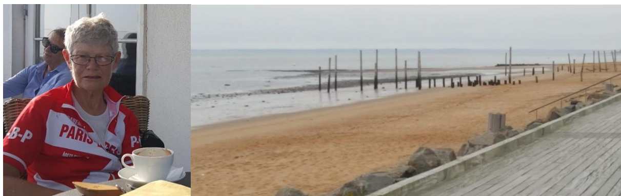
Hjerting badehotel er nået, kaffe på terrassen. Strandpromenaden

Håbede at finde en købmand undervejs. Det blev en meget øde og mennesketom vej, jeg kørte. Begyndte at fantasere om ikke, der bare sad nogle mennesker i en have, hvor man kunne købe kaffe. De eneste jeg så, var nogle håndværkere ved et hus. De var til gengæld flinke at give mig noget olie til kæden, der var begyndt at knirke højlydt. Efter Oksbøl kom jeg ind i naturreservatet ved vadehavet. Igen et flot område. Inden badhotellet var der en flot strandpromenade. I det gode vejr var der fyldt op med masser af mennesker og dyre biler.