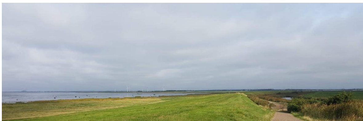
En dæmning mere. Der var mange af dem.

Vinden var fin, indtil vi nåede grænsen. Herefter var der strid modvind de sidste 10 km indtil Tønder.