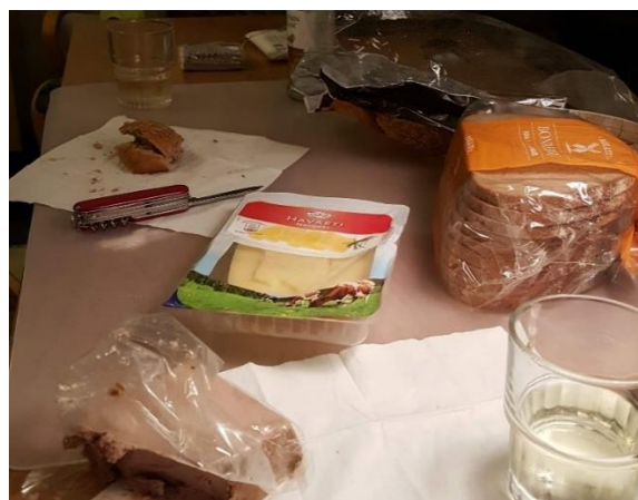
Ganske udmærket middag i Hanstholm, indkøbt i Aldi. Vi fik brug for min lommekniv.