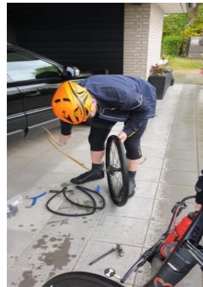
Mange punkteringer og mange hjul fik nye slanger undervejs i årets fléche

7 hold gennemførte fléchen indenfor de gældende regler mens et enkelt hold valgte at stoppe kollektivt undervejs. Der var derudover et mindre frafald fordelt på forskellige hold. Et resultat, som må siges at være godt under meget udfordrende vejræssige betingelser. Efter et par forårsmåneder, der har følt som et langt regn og blæsevejr med for årstiden usædvanligt kolde temperaturer, virkede det for deltagerne som om alle vejrelementerne kulminerede under fléchen. Efter fléchen var alle vist enige om, at det havde været en ret hård og barsk tur.