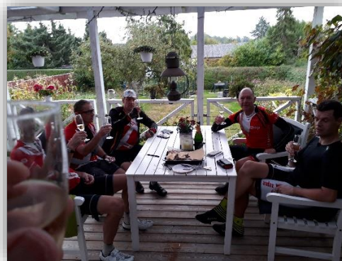
ARD Sjælland fejrede 100 år med 200km den 11. september med champagne ved målgangen. En dejlig og hurtig tur blev det for de fremmødte.

Vejret var vådt i vest og bedre i øst, men det tog ikke glæden ved begivenheden og det at kunne følges.